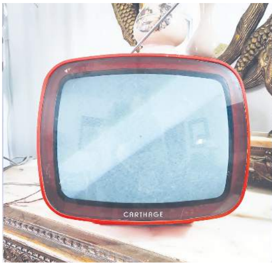
Un poste de télévision rétro des années 1960-1970 de la marque tunisienne « Carthage ».

La Presse — Le 26 janvier 1926, dans un atelier lugubre du 22 Frith Street, au cœur du quartier animé de Soho à Londres, l'ingénieur britannique d'origine écossaise John Logie Baird — inventeur tenace, marginalisé et souvent sous-financé — avait réalisé une prouesse technique, pour ne pas dire une révolution technologique, qui allait changer à jamais les sociétés...