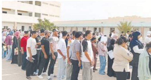
Lycée Houcine-Bouzaiène Gafsa

Hier, la Tunisie a donné le coup d'envoi du baccalauréat 2026, première étape d'un marathon national qui mobilise élèves, familles et institutions. Nos journalistes ont sillonné les régions pour capter l'atmosphère de ce démarrage, entre tension palpable et espoir ardent. Partout, les salles d'examen se sont transformées en théâtres de concentration, où chaque regard traduit l'enjeu d'un avenir en construction. Ce premier jour révèle déjà la force d'une jeunesse qui, malgré les incertitudes, continue de croire en son propre destin.